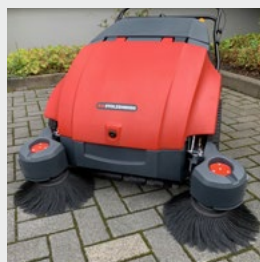
Ausgeschwenkter rechter Seitenbesen