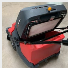
Öffnung des Staubkastens zum Einwerfen von Großteilen